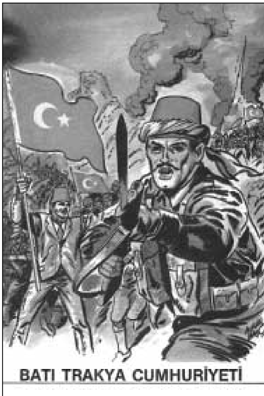
«Δημοκρατία Δυτικής Θράκης» (από την συνέκδοση της εφημερίδας Milliyet και της Έμπορικῆς Τραπεζῆς τῆς Τουρκίας, τοῦ ἔργου μέ τίτλο «Τά Τουρκικά Κράτη στήν Ἱστορία») Ἀρχεῖο Ἰάκωβου Ζ. Ἀκτσόγλου