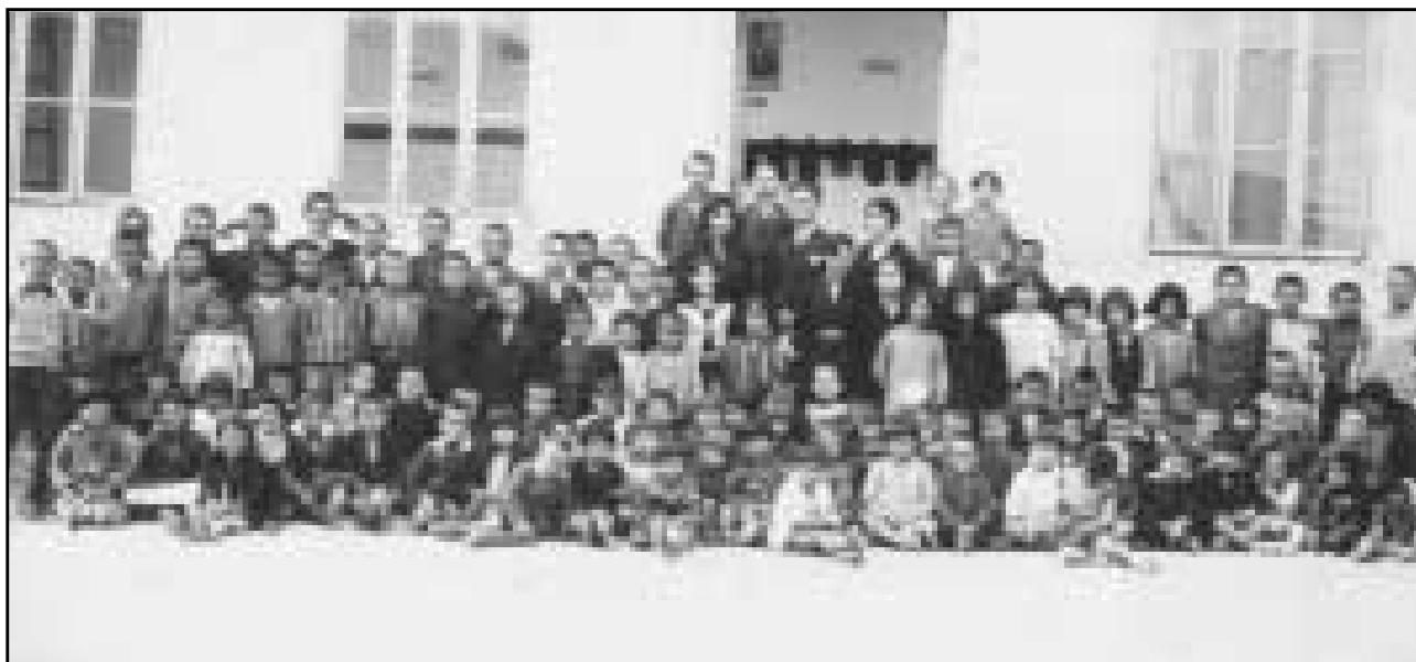
Σοῦνιο Ροδόπης, δεκαετία τοῦ '30. Δάσκαλοι καί μαθητές μπροστά στό δημοτικό σχολεῖο. ΑΡΧΕΙΟ Δ. ΧΑΤΖΗ.

Κατά τή διάρκεια τῶν Βαλκανικῶν Πολέμων καί τοῦ Πρώτου Παγκόσμιου Πολέμου, τό χωριό καί ὅλη ἡ περιοχή τῆς Θράκης εἶχαν καταληφθεῖ ἀπό τούς Βουλγάρους (1913-1918). Ἐπειδὴ οἱ Βούλγαροι θεωροῦσαν τούς Πομάκους συμπατριῶτες τους πού μεταστράφηκαν στόν Ἰσλαμισμό, δημιούργησαν βουλγαρικά σχολεῖα καί προσπάθησαν νά τούς προσηλυτίσουν μέ τήν βία στόν χριστιανισμό. Οἱ ὀδυνηρές μνημεις εἶναι ἀκόμα ζωντανές στίς διηγήσεις τῶν γερόντων